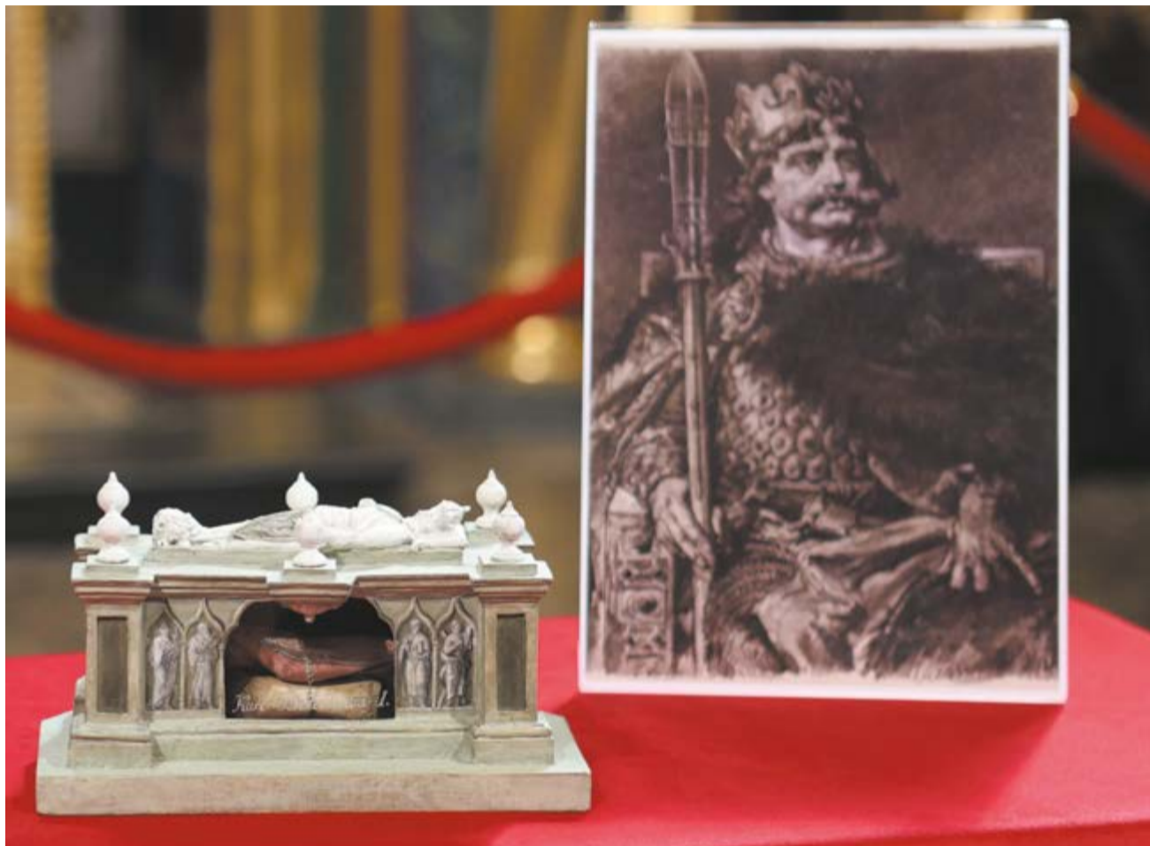
Obejrzyć można było fragment palca