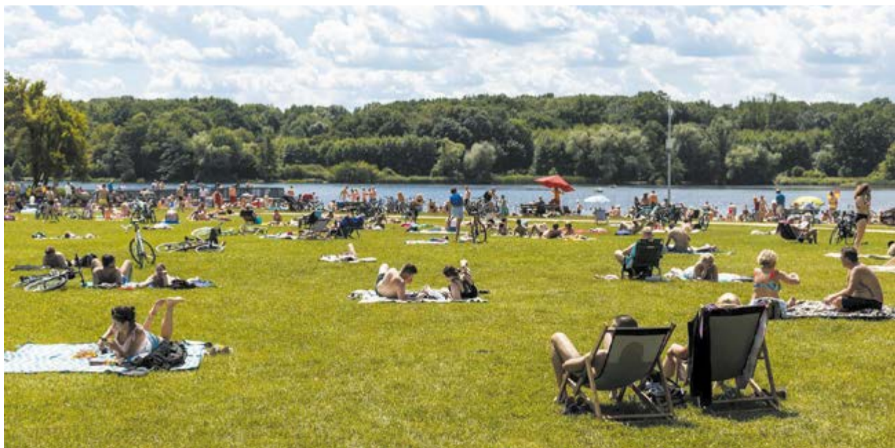
Plaża w Strzeszynku