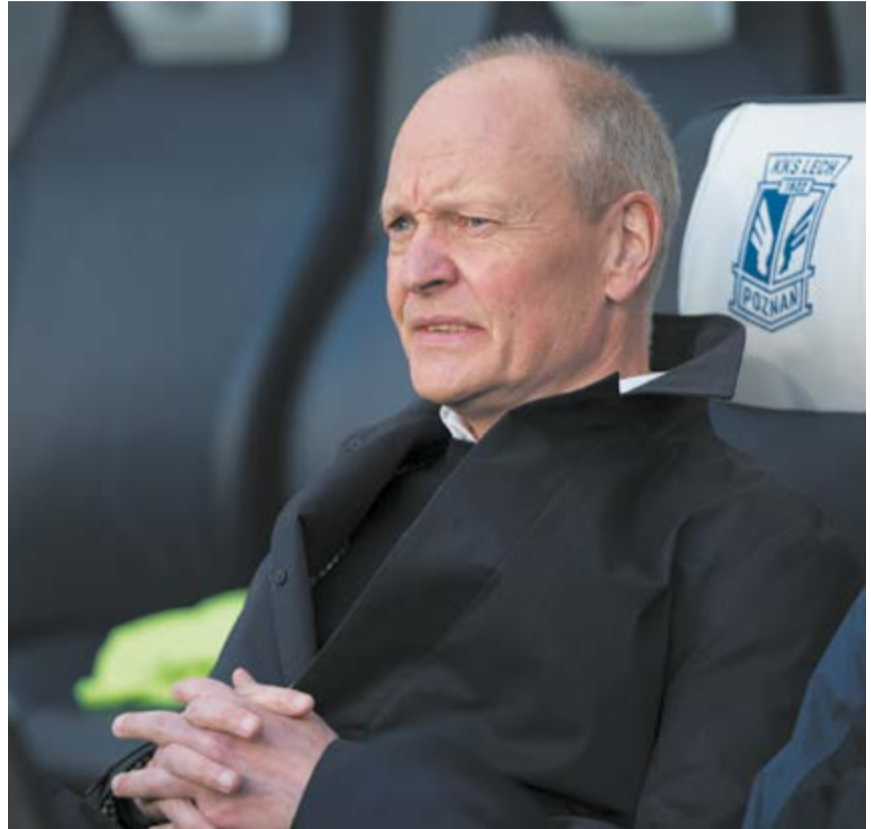
Niels Frederiksen docenia przeciwników

Piłkarze Lecha Poznań poznali swoich rywali przebywając na urloпах. Do Poznania wrócili 22 czerwca, a dzień później rozpoczęli okres przygotowawczy. Wśród nich nie będzie Alego Golizadeha, który przechodzi proces rehabilitacji po operacji więzadeł kolana. Do drużyny Lecha Poznań dołączyli Mateusz Lis oraz Allahyar Sayyadmanesh. Nowego sezonu w Kolejorzu nie zainicjują Timothy Ouma, Taofeek Ismaheel oraz Plamen Andreev.