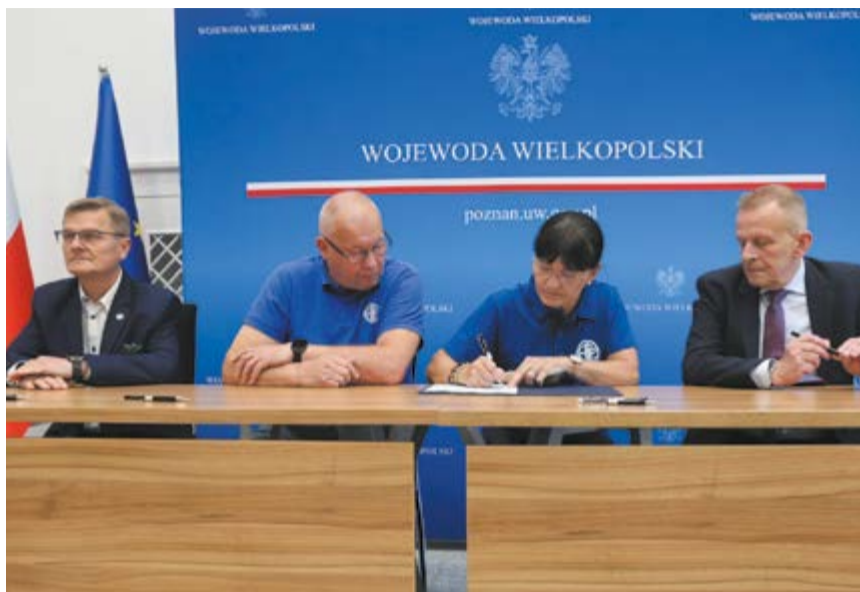
Czy fuzja okaże się sukcesem?