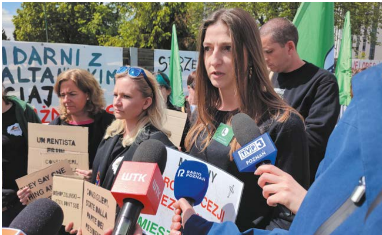
Protestuje przeciwko sprzedaży działek z mieszkańcami

Jak udało się ustalić w trakcie dzienni-