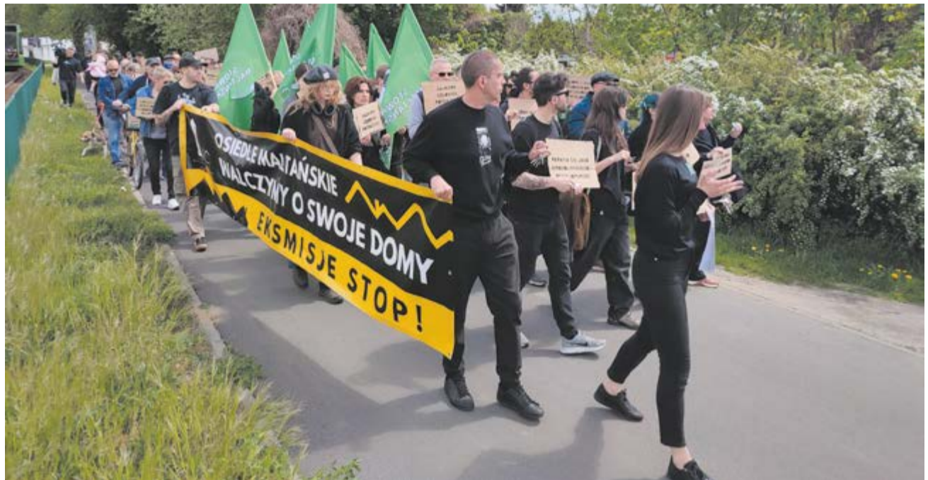
Hasło „Eksmisje stop” po blisko 14 latach pojawia się także podczas protestu 9 maja