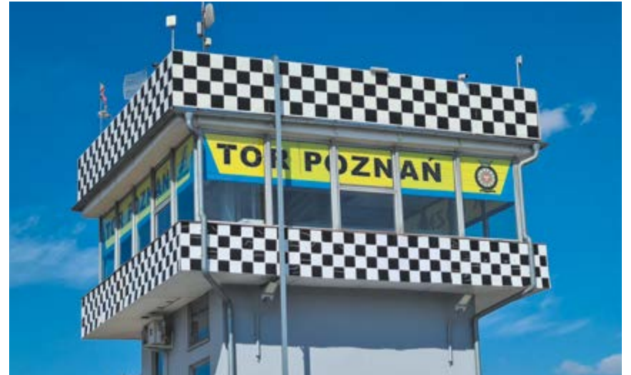
Nowa ustawa ma uratować Tor Poznań