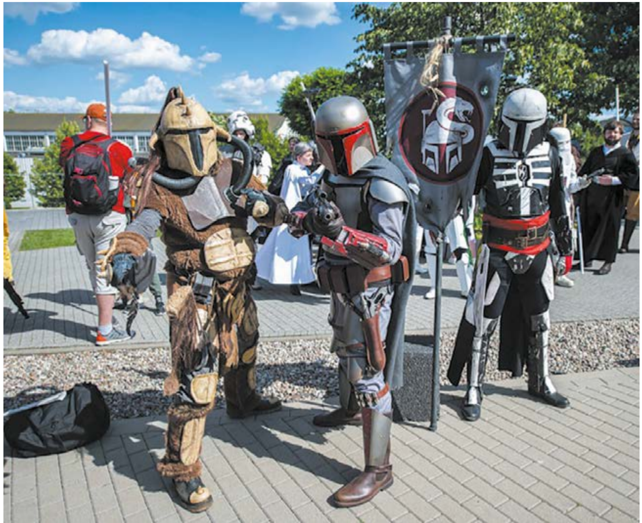
To największa tego typu impreza w tej części Europy

Tegoroczny Pyrkon ma ponad 2 tysiące punktów programu. Obejmuje on masę prelekcji, konkursów, turniejów, koncertów oraz programy godzinowe