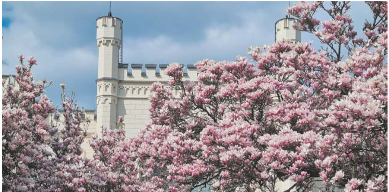
W arboretum w Kórniku ruszy remont