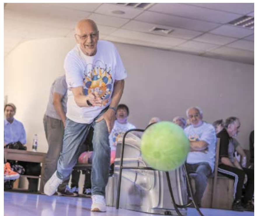
Wszyscy seniorzy są mile widziani