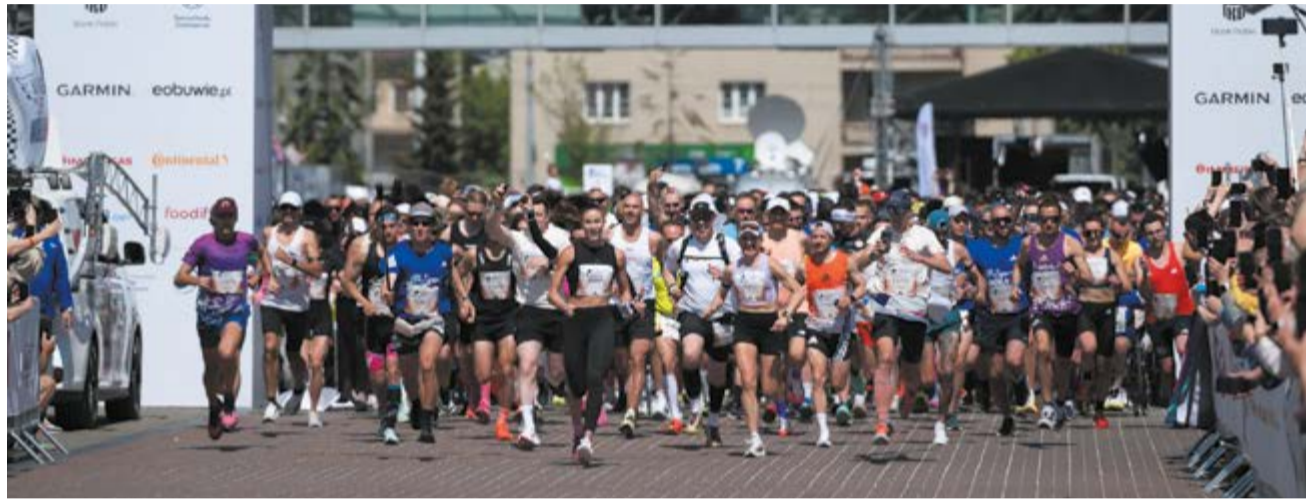
Był drugi w światowej klasyfikacji