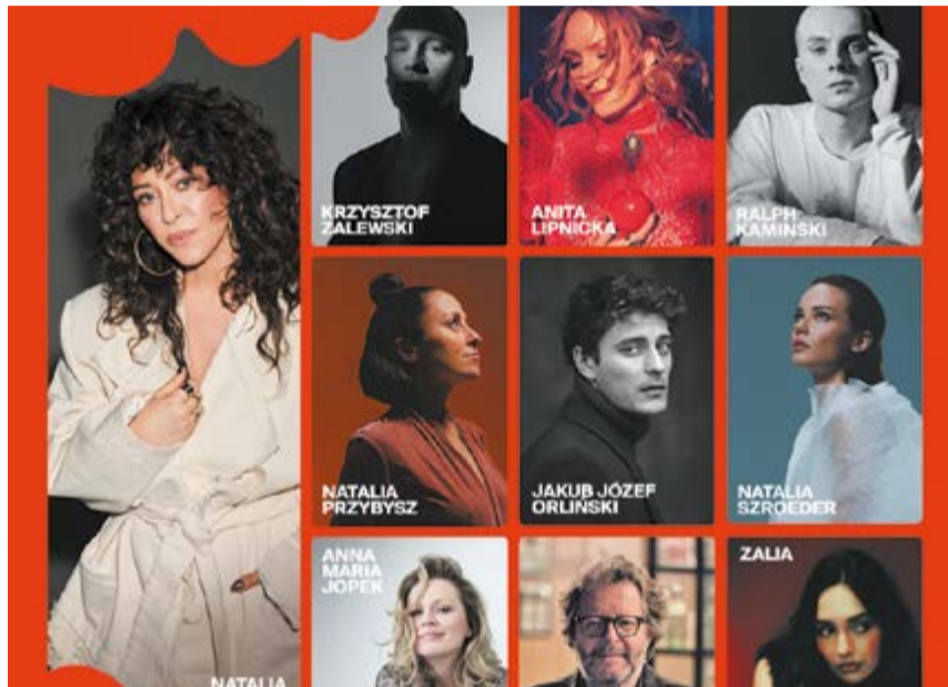
To nie będzie zwykły koncert

Za warstwę narracyjną pomiędzy aktami odpowiadać będą Maria Dębska oraz Maciej Stuhr. Koncert zostanie zarejestrowany przez TVN i wyemitowany niedługo potem. Wstęp na wydarzenie jest bezpłatny. Zaplanowano je na 21 czerwca na mecie toru regatowego. O godzinie rozpoczęcia organizator poinformuje niebawem.