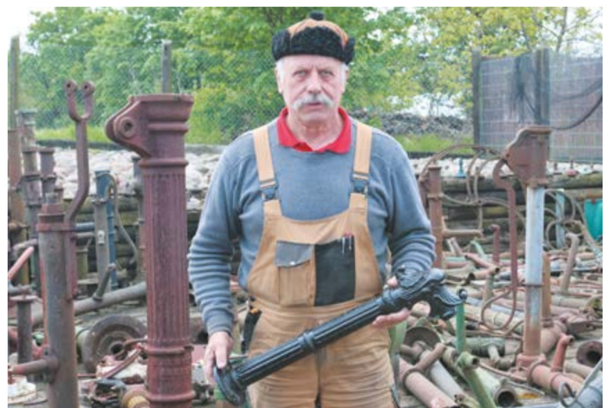
Jedni kolekcjonują obrazy, inni pompy

– Jak kupiliśmy z żoną ziemię, to jedna pompa tu była. To jest atrybut wiejskiego domu i ogrodu. I tak się zaczęło – opo-