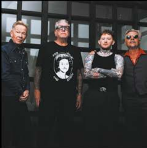
STEVE JONES PAUL COOK GLEN MATLOCK FEATURING FRANK CARTER SEX PISTOLS