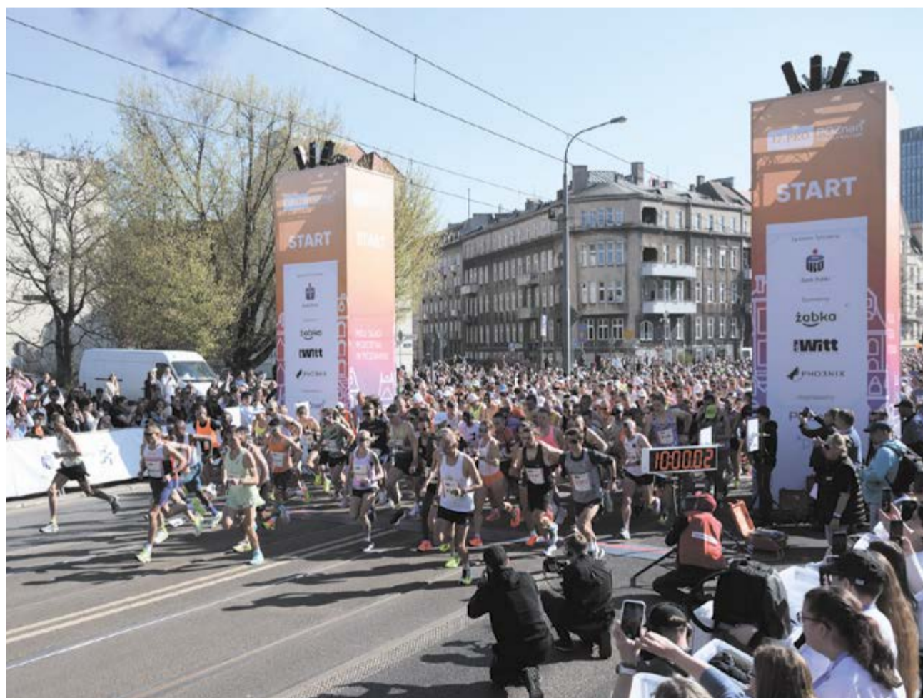
Start półmaratonu w tym roku zaplanowano na godz. 9:00