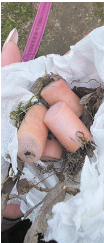
Uważajcie na psy