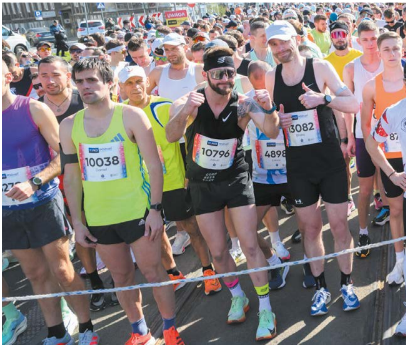
Na tegoroczny poznański półmaraton zapisało się 14,5 tys. osób

Nowa trasa prowadzi przez ulicę Głogowską. Następnie ulicami: Hetmańską, Arciszewskiego, Ściegiennego, Taczanowskiego i Jugosłowiańską biegacze dotrą do ulicy Grunwaldzkiej. Trasa wiedzie nią aż do skrzyżowania z ulicą Cmentarną. Uczestnicy okrążą Lasek Marceliński i dotrą do ulicy Bukowskiej, skąd skręcą w ulicę Bułgarską. Trasa poprowadzi przez środek Stadionu Miejskiego, a następnie ulicą Grunwaldzką w stronę