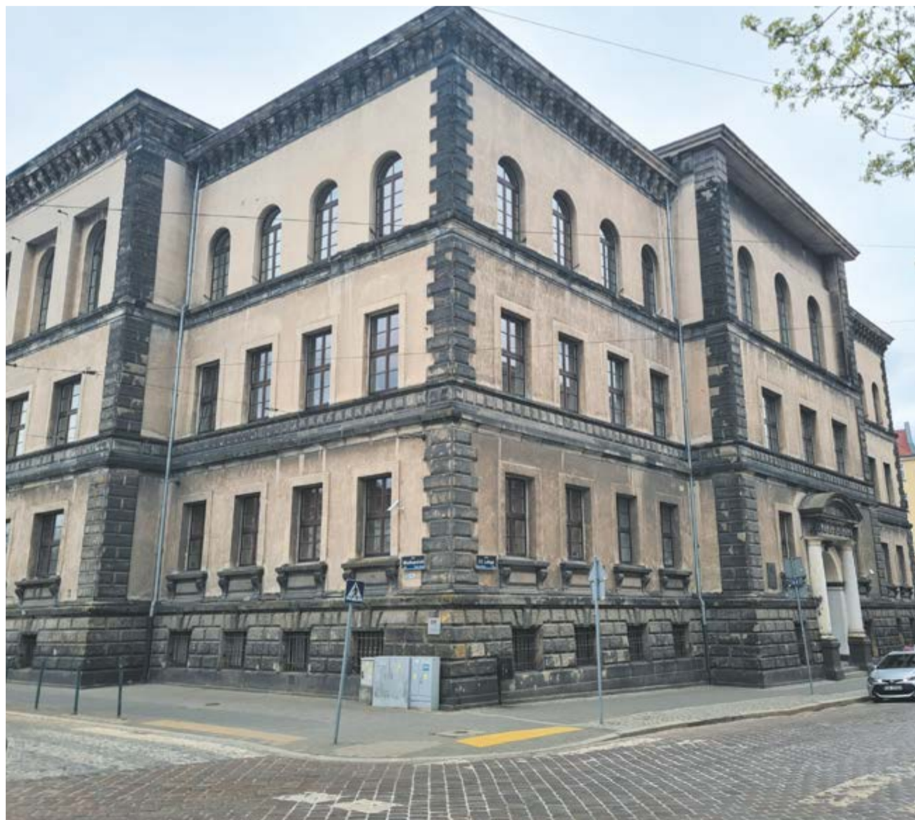
Budynek Archiwum Państwowego w Poznaniu