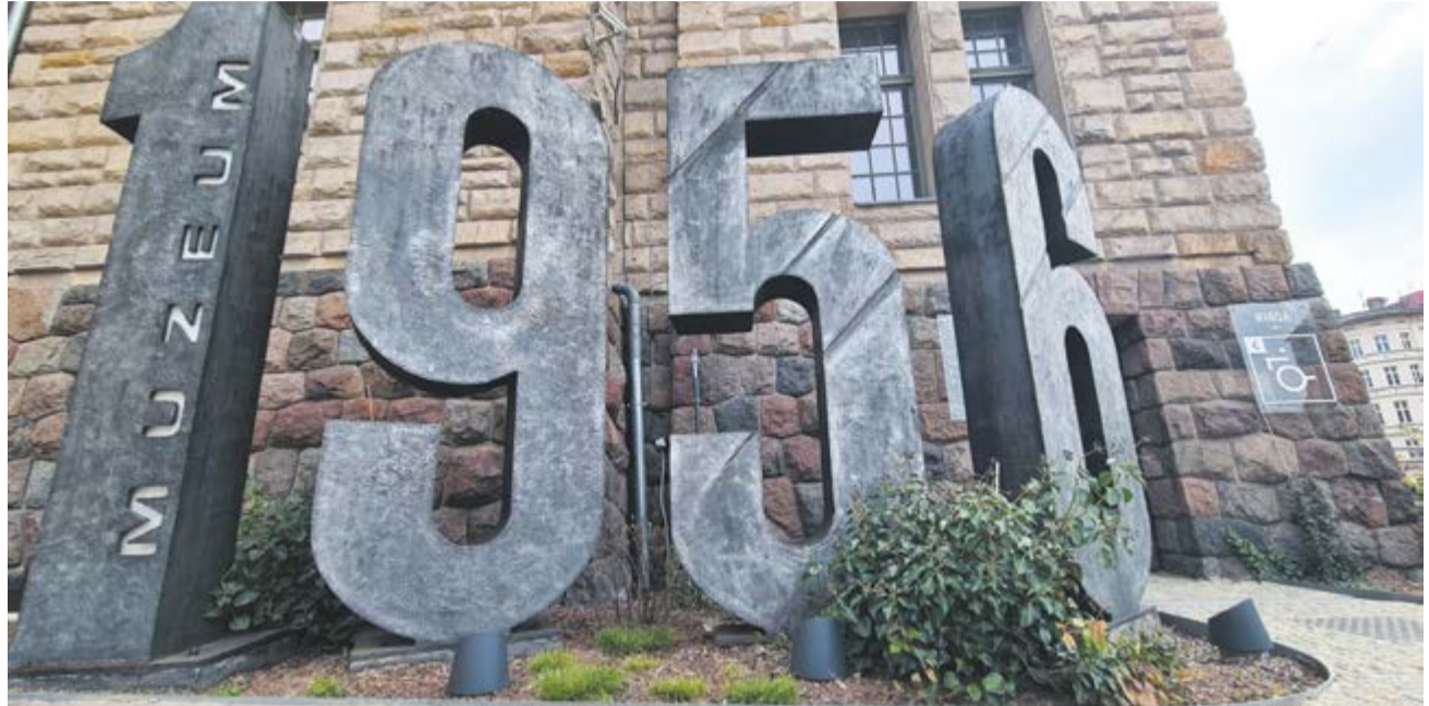
Muzeum Powstania Poznańskiego