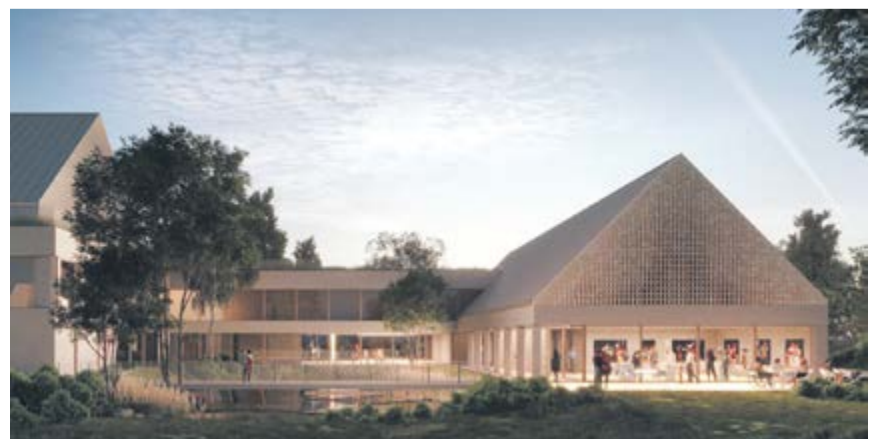
Wizualizacja nowego CK w Tarnowie Podgórnym