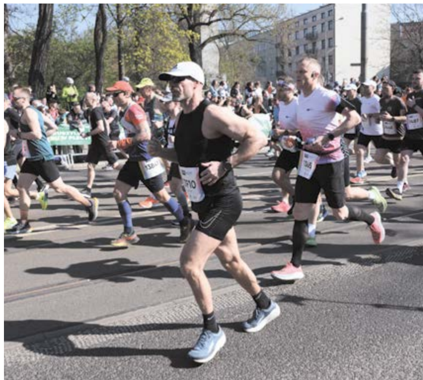
Trasa jest szybsza. Czy pobiją rekord?